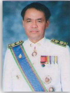
ปลัดจังหวัดมหาสารคาม