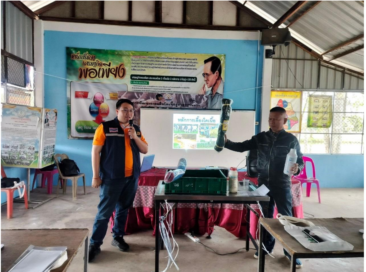
ครึ่งที่ ๗