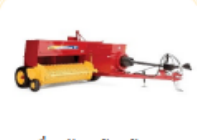
เครื่องอัดหญ้าแห้ง/ฟาง

ติดต่อสอบถาม : สำนักพัฒนาอาหารสัตว์ กรมปศุสัตว์ 02-5011148