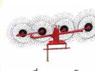
เครื่องคราดหญ้า