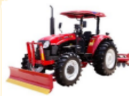
รถฟาร์มแทรกเตอร์