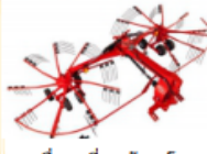
เครื่องเกลี่ยหญ้า 2 โรเตอร์